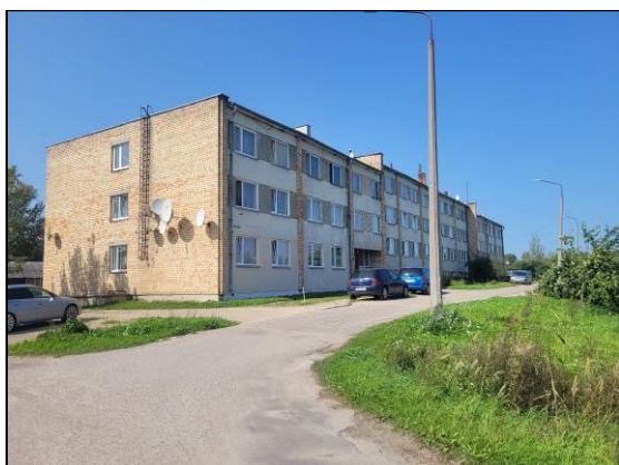
Dzīvojamā māja (fasāde)