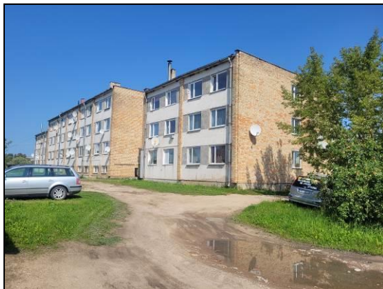
Dzīvojamā māja (fasāde)