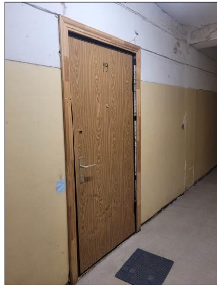
Kāpņu telpas (dzīvokļa ārdurvis)