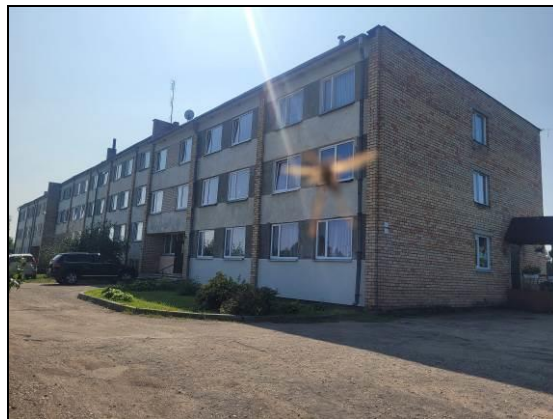
Dzīvojamā māja (fasāde)